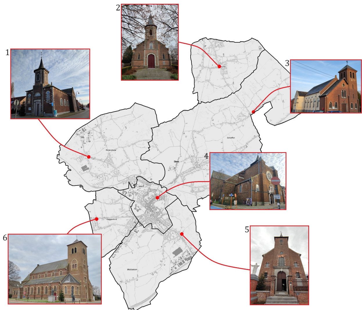
Afbeelding 2. De zes kerken in deze haalbaarheidsstudie op een kaart van Diest.